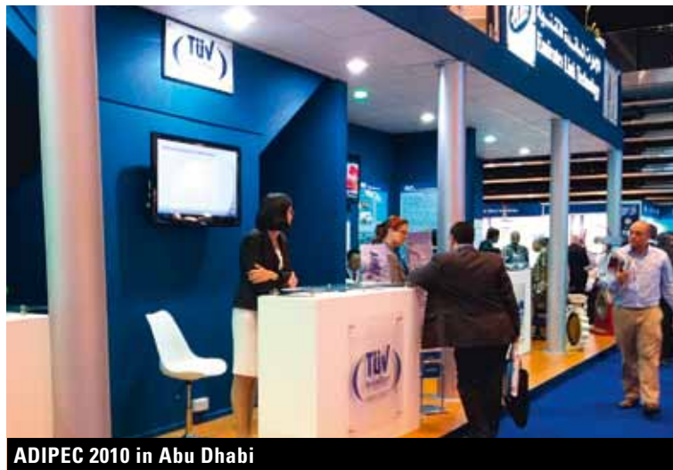
ADIPEC 2010 in Abu Dhabi

Aber nicht nur an der ADIPEC als führender Messe der Ölindustrie hat TÜV InterCert aktiv teilgenommen, sondern auch an vielen führenden Messen aus den Bereichen Photovoltaik und erneuerbare Energien. Hier eine kurze Jahresübersicht aller Messen: