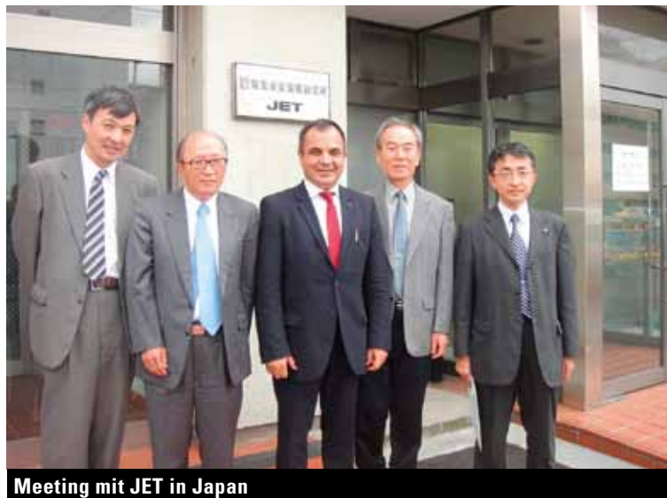
Meeting mit JET in Japan

Der neue Kooperationspartner Japan Electrical Safety & Environment Technology Laboratories (JET) aus Japan trägt seit 2010 ebenfalls zu dieser Vielfalt bei. JET wurde 1963 vom japanischen Ministry of Economy, Trade and Industry (Wirtschafts-, Handels- und Industrieministerium) als benannte Prüfstelle gegründet und ist damit ein wichtiger Partner für den japanischen Markt.