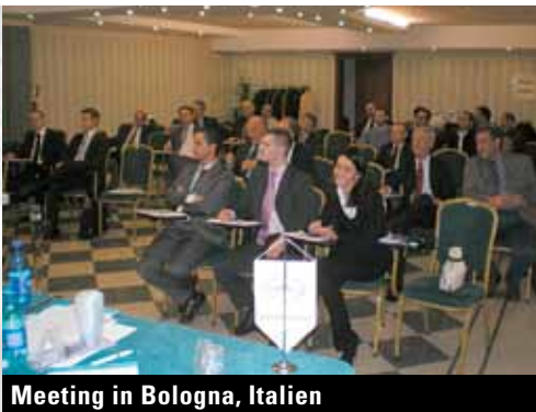
Meeting in Bologna, Italien

Der internationale Austausch mit unseren Partnern über Normen und Besonderheiten in den einzelnen Ländern stand auch 2010 im Vordergrund.